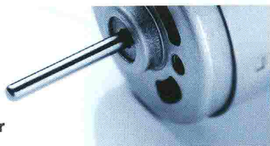
LONG - LIFE DC - PRO Motor

Tartós DC-PRO motor: Az ultrakönnyű hosszú élettartamú DC-Pro motorok az egyenáramú motorok legújabb generációját képviselik. A Valera professzionális hajszárítói különleges ventilációs technológiájának köszönhetően, a DC-Pro motorok erős légáramot képesek előállítani, hasonlóan a klasszikus, de jóval nehezebb AC motorokhoz. Ez lehetővé teszi a professzionális fodrászoknál használatos vékony szűkítő használatát. Az ilyen típusú motorok várható élettartama hozzávetőleg 1200 óra.