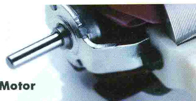
LONG - LIFE AC Universal Motor

A Valera 1955 óta gyárt hajformázási eszközöket. Folyamatos figyelmet szentel a haj egészségének és megjelenésének, vagyis az egyedi stílusnak és kényelemnek.